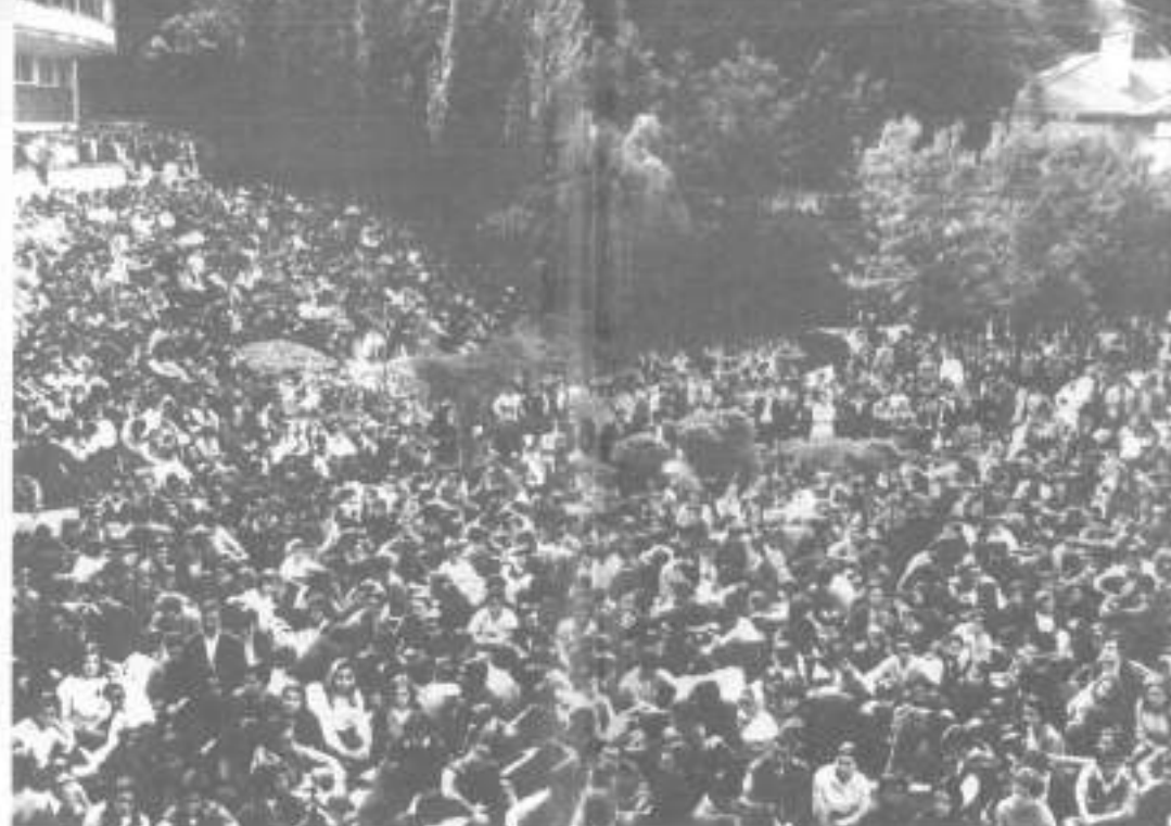
Coimbra, 1969. Seis mil estudantes decretam greve aos exames.

Aproveitando a mobilização alcançada pela CPE e a vitória anunciada da marcação de eleições, realiza-se mais uma comemoração da Tomada da Bastilha, em Novembro. Da reunião nacional que então se realiza, sai um comunicado conjunto e um relançamento da luta estudantil.