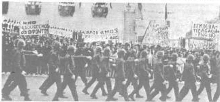
Coimbra, 1969. Estudantes e regime medem forças.

A direita do regime, com os militares à cabeça, resolve exigir eficácia. Circula um abaixo-assinado que pugna por "medidas imediatas de reforço da autoridade". Estão presos por "sedição" mais de cinquenta estudantes, enquanto outros, em igual número, respondem em processos disciplinares. Durante as férias, a AAC é encerrada pelo governo e os seus dirigentes ainda em liberdade são presos. Libertados no final do mês, os associativos acabam por ser incorporados compulsivamente nas forças armadas. Na partida do comboio que os levará ao quartel, uma grande manifestação entoava palavras de ordem contra a guerra colonial. A polícia de choque, mais uma vez, tratará de repor a "normalidade".