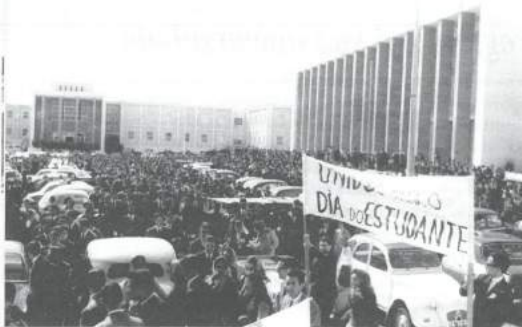
Lisboa, 1962. Manifestação na Cidade Universitária.

"normalidade". Depois de adiar o Académica-Beira Mar, a que os de Coimbra planeavam faltar, o governo joga o mais alto trunfo repressivo, ilegalizando as associações de estudantes, a RIA, emitindo novas regras sobre a comparecência às aulas e apresentando o luto académico como um atentado à liberdade dos que queriam seguir o lema de Salazar: "o estudante, estuda".