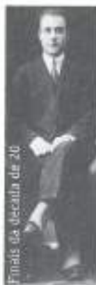
Finais da década de 20