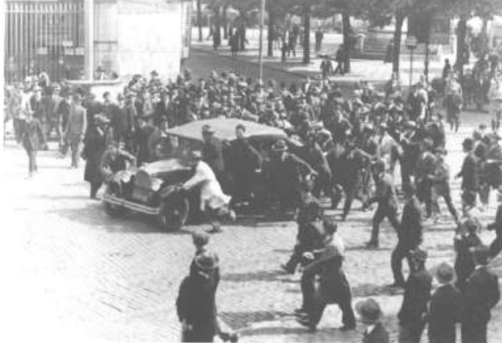
Porto. Manifestação no 1º Maio de 1931.

publicamente a proclamação da República em Espanha e se sucedem as cargas policiais e as prisões. Ainda se resistia no Funchal aos bombardeamentos da marinha de guerra, quando a 29 de Abril, em Lisboa, os estudantes de Direito invadem a sua faculdade numa greve destinada a fazer crescer a agitação social em vésperas de um movimento revolucionário congeminado no seio da loja maçónica "Revolta". As outras faculdades não conseguem seguir o exemplo de Direito e a vaga repressiva conduz muitos estudantes à prisão e à reprovação por faltas.