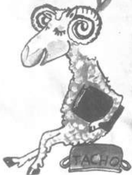
Ironia estudantil sobre o discurso do ministro José Hermano Saraiva na televisão.

professores. Mas o clima não propicia grandes mobilizações. A direcção da AAC não está disposta a ceder ao ímpeto da confrontação permanente com as autoridades. Por estranho que pareça, foram as autoridades a despoletar o acontecimento: primeiro com a suspensão dos principais dirigentes associativos: sucedem-se as assembleias estudantis e é decretado o "luto académico". Para piorar a situação, José Hermano Saraiva, que transitara do governo de Salazar para o de Caetano, apresenta na TV a solução para o problema de Coimbra: "A ordem vai ser estabelecida" - a universidade foi sitiada pela polícia e as aulas encerradas pelo ministério. Os estudantes resolvem suspender a Queima das Fitas. As assembleias estudantis sucedem-se e 6 mil estudantes decretam a greve aos exames. De pouco adianta ao ministro Hermano Saraiva a proibição das reuniões - elas acontecem onde quer que seja, mesmo sob a atenção da PIDE.